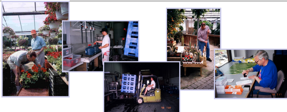
Activités d'initiatives bénévoles et de placements d'emploi