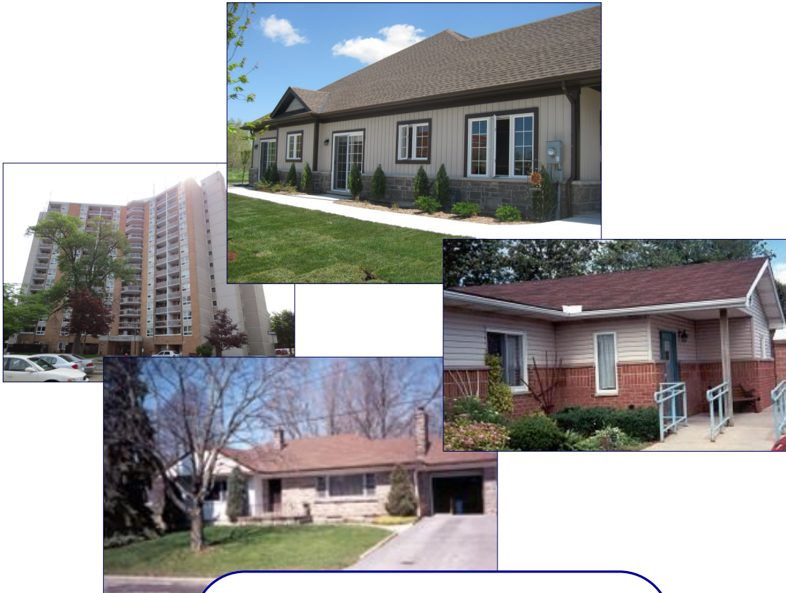
Services en établissement et Programme d’appartement de transition

Nous avons mis sur pied un certain nombre de programmes afin de répondre aux besoins variés des personnes ayant une lésion cérébrale acquise. Pendant l’entretien d’accueil, on expliquera ces programmes au demandeur et à sa famille. Les décisions concernant la participation aux programmes tiennent compte des désirs et objectifs du demandeur, des souhaits de la famille, de la disponibilité des programmes et des recommandations de professionnels.