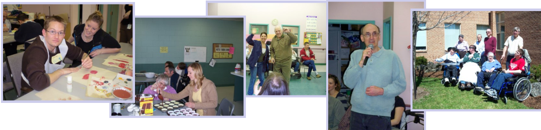
Activités du programme PET