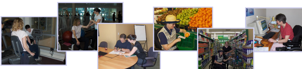
Divers événements communautaires

Le Programme de services de soutien communautaire a pour but de faciliter la réintégration communautaire des personnes ayant une lésion cérébrale acquise. Comme les services sont habituellement d'une durée limitée, nous encourageons les participants à trouver d'autres personnes au sein de leur réseau de soutien qui pourraient, au besoin, les soutenir à plus long terme.